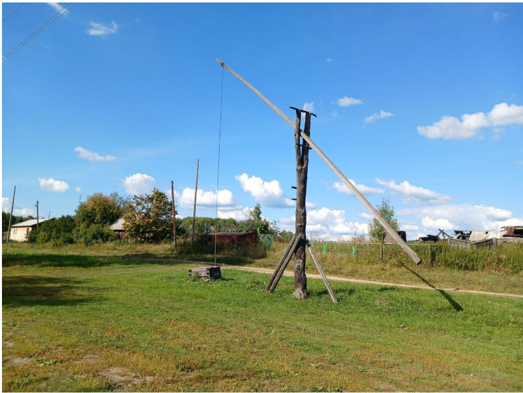
Колодец журавль, д.Тямкина