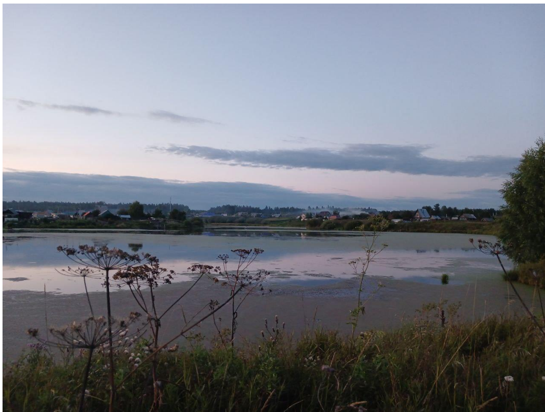
Вид с возвышенности у реки Айба на деревню Юшкова