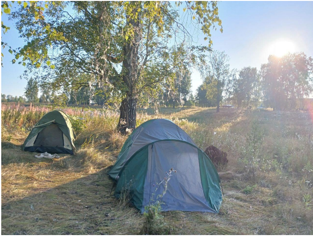
10.08. д.Тямкина наш бивак