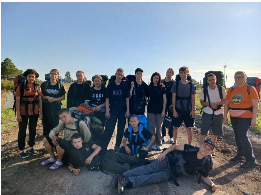
Утро 11.08. «До свидания, деревня Тямкина».