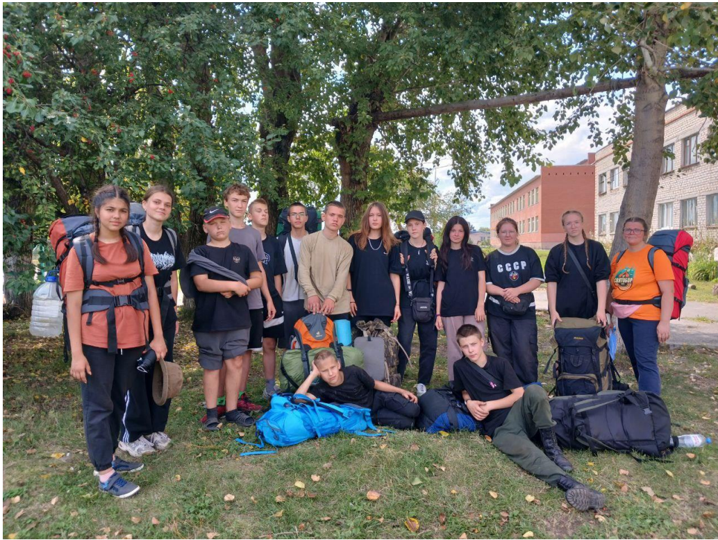
11.08. Мы дома. Тугулым.