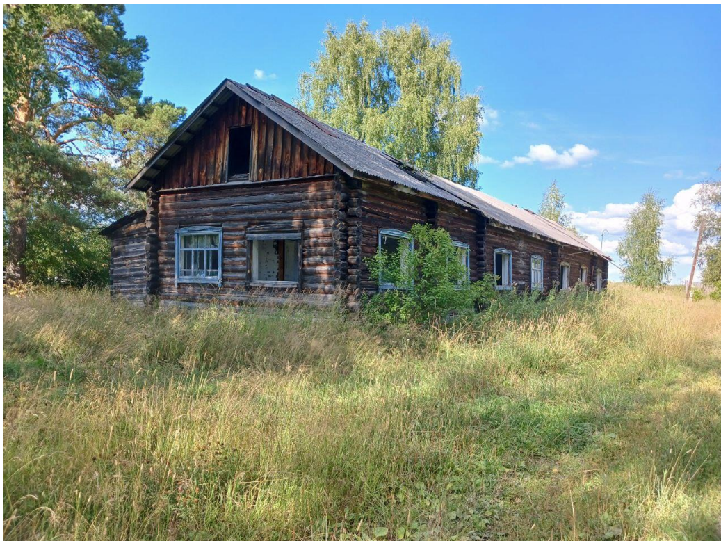
Начальная школа и сельский Дом культуры, д.Тямкина