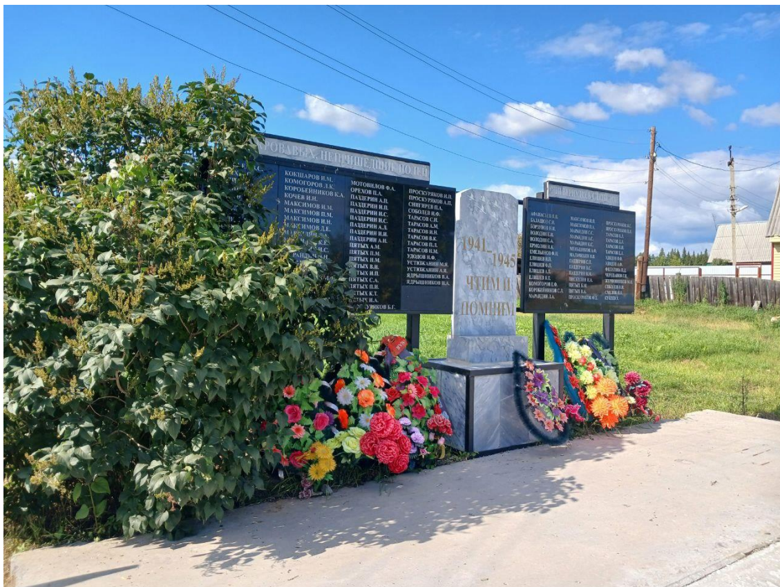
Памятник участникам Великой Отечественной войны, д.Юшкова