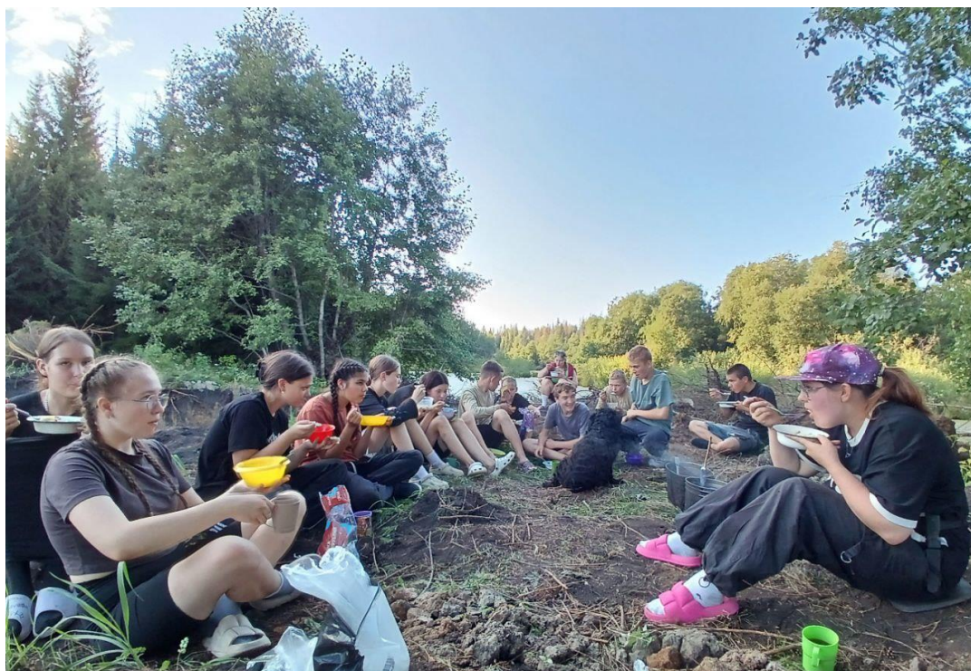
«Вот уже и готова еда!»